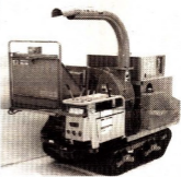
ディーゼルエンジン搭載の自走式、軽トラトラック搭載の自走式

軽トラトラック搭載式は、軽トラトラックの荷台に搭載し、作業範囲を広げ、作業効率を向上させます。また、ディーゼルエンジン搭載の自走式も、大規模な作業に適しています。高効率で良質チップを産出でき、竹やわらなどの処理も可能です。