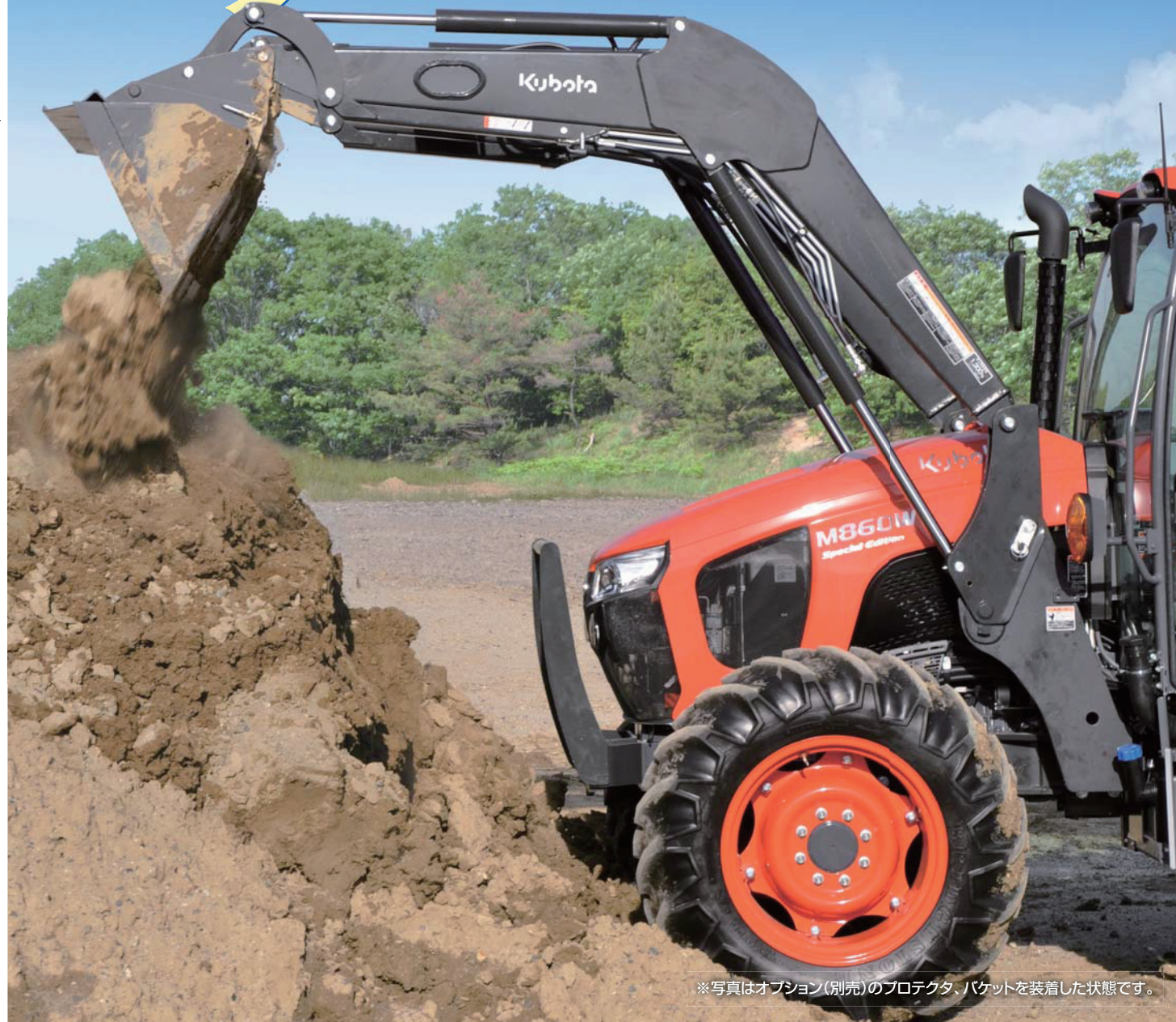
※写真はオプション(別売)のプロテクタ、バケットを装着した状態です。

WORLDシリーズ特別仕様トラクタにベストマッチ! シンプル・パワフル・ グレイタス!