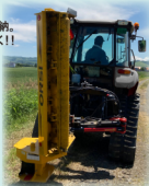
※収納時はドライブシャフトの 長さにご注意ください。

ワンウェイ内蔵ギヤボックス Vベルト自動テンション 「スキッド」でモーター外側下面をガード 「プロテクションチェーン」で前部石飛防止